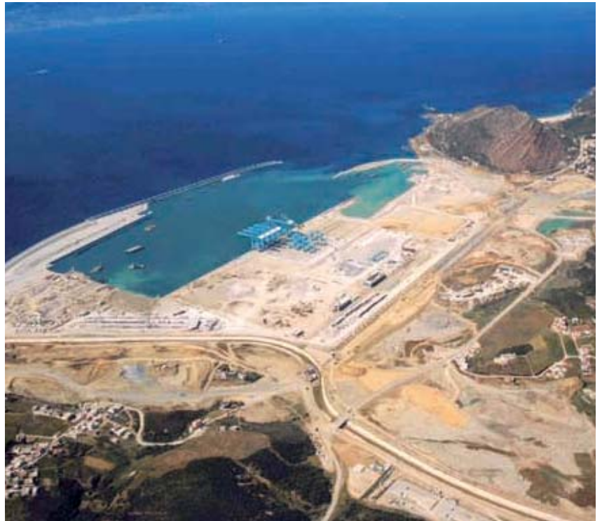
El puerto de TangerMed ejemplifica el desarrollo logístico de Marruecos en los últimos años