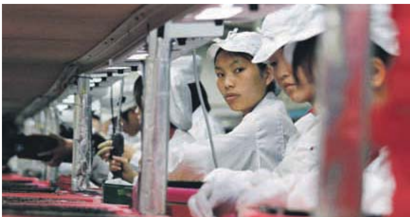
Los costes logísticos de China representan, en la actualidad, el 18% del PIB

Ante esta situación, y de la misma forma que a mediados de los años