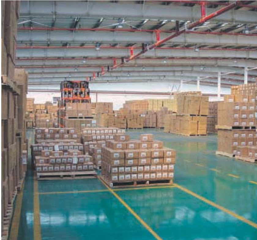
China debe impulsar el mercado doméstico a medida que la economía es menos dependiente de la exportación

>>Viene de la página anterior sistema eficiente de distribución nacional y optimizar la estructura de costes. Aunque la relocalización de las instalaciones desde las zonas costeras al interior del país parece ser una medida sensata para combatir la inflación de costes, los problemas de transporte se están convirtiendo en el siguiente desafío para alcanzar este objetivo. Así lo aseguran los expertos del informe que explican además, que un estudio de mercado realizado por Morgan Stanley a 200 grandes empresas que operan en China, muestra